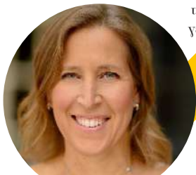
Susan Wojcicki (Η.Π.Α.): CEO του YouTube (παρατήθηκε πρόσφατα μετά από 8 χρόνια στη θέση αυτή)