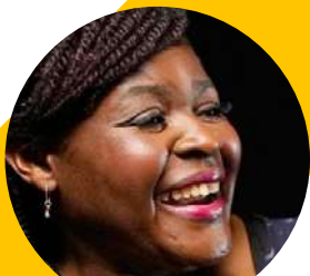
Dr Maggie Aderin-Pocock (Ηνωμένο Βασίλειο): Επιστήμον του Διαστήματος και καθηγήτριας