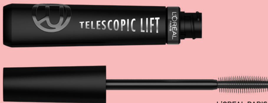
L'OREAL PARIS, TELESCOPIC LIFT MASCARA

Μήπως μιλάμε για την επιστροφή του smokey eye; Μπορείς να το πεις κι έτσι, αφού το «μουτζουρωμένο» eyeliner αλλά και η εφαρμογή σκιών με την τεχνική «όμπρε» κάνουν ξανά την εμφάνισή τους το 2023. Μπορείς να παίξεις με μαύρο ή και αποχρώσεις του καφέ και του σκούρου κόκκινου, μην προσπαθείς για το τέλειο, όσο πιο «άτασλο» το αποτέλεσμα τόσο πιο in fashion.