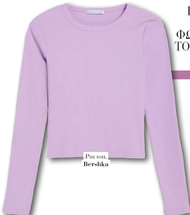
Ριγέ τοπ, Bershka