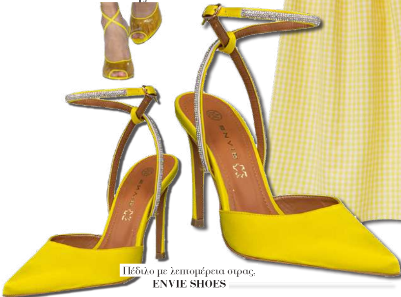
Πέδιλο με λεπτομέρεια στρας, ENVIE SHOES