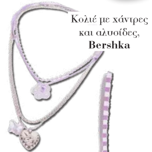
Κολιέ με χάντρες και αλυσίδες, Bershka