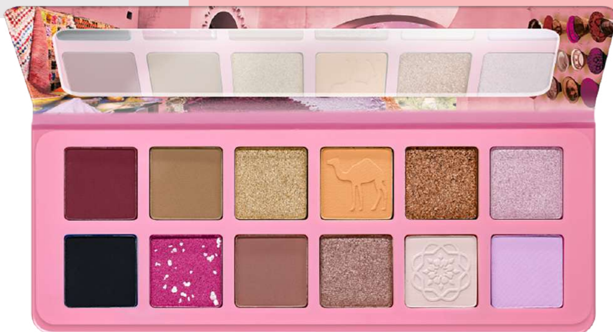
ESSENCE, WELCOME TO MARRAKESH EYESHADOW PALETTE

Οι βλεφαρίδες σου χρειάζονται σίγουρα αυτή τη μάσκα με σύνθεση με κεραμίδια και καινοτόμο βουρτσάκι 2 σε 1, το οποίο πιάνει και ανυψώνει τις βλεφαρίδες οποιουδήποτε μήκους έως 5mm. Προσφέρει όγκο και γύρισμα με διάρκεια έως και 36 ώρες και είναι κατάλληλη ακόμη και για χρήστριες φακών επαφής.