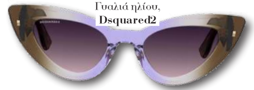
Γυαλιά ηλίου, Dsquared2