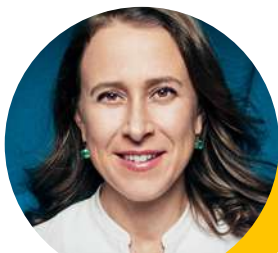
Anne Wojcicki (Η.Π.Α.): συνιδρύτρια και CEO της πλατφόρμας 23andME (ιδιαίτερα δημοφιλής πλατφόρμα γενετικών τεστ που αφορούν στην υγεία, καταγωγή και άλλους παράγοντες)

Γ ια μια ακόμη χρονιά, η Mattel επέλεξε να αναδείξει γυναίκες - ηγέτες από τους κλάδους των επιστημών STEM (Science, Technology, Engineering, Math), με αφορμή την Παγκόσμια Ημέρα της Γυναίκας. Οι επιστήμονες αυτές «απαθανάτιστηκαν» αποκτώντας η κάθε μια τη δική της εκδοχή της iconic κούκλας Barbie, στο πλαίσιο μιας προσπάθειας που η εταιρεία έχει ξεκινήσει εδώ και χρόνια, για να προβάλλει θετικά πρότυπα που ξεπερνούν τα στερεότυπα στα κορίτσια, θέλοντας με αυτό τον τρόπο να ενθαρρύνει την ενασχόληση με τις επιστήμες, έναν κλασικά ανδροκρατούμενο κλάδο. Οι επιλεγθείσες επιστήμονες της φετινής σειράς προέρχονται από όλο τον κόσμο και είναι οι παρακάτω: