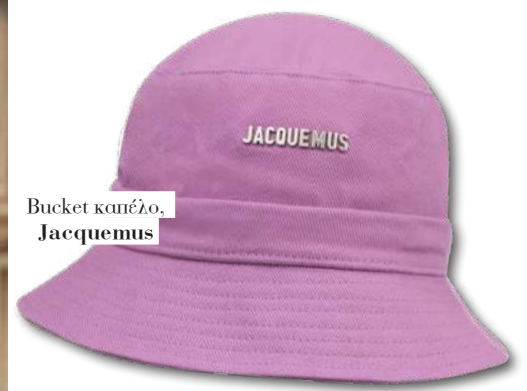
Bucket καπέλο, Jacquemus