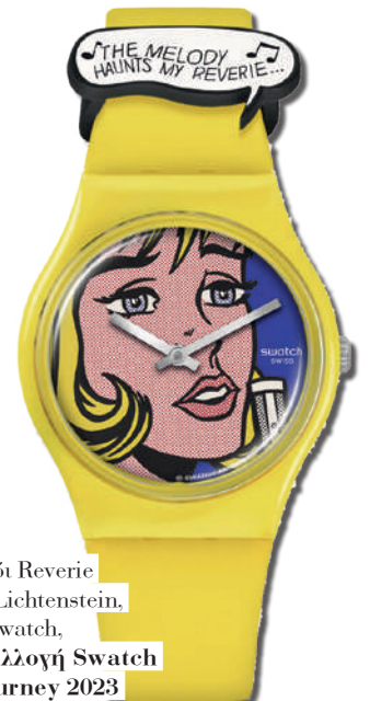
Ρολόι Reverie by Roy Lichtenstein, Swatch, από τη συλλογή Swatch Art Journey 2023