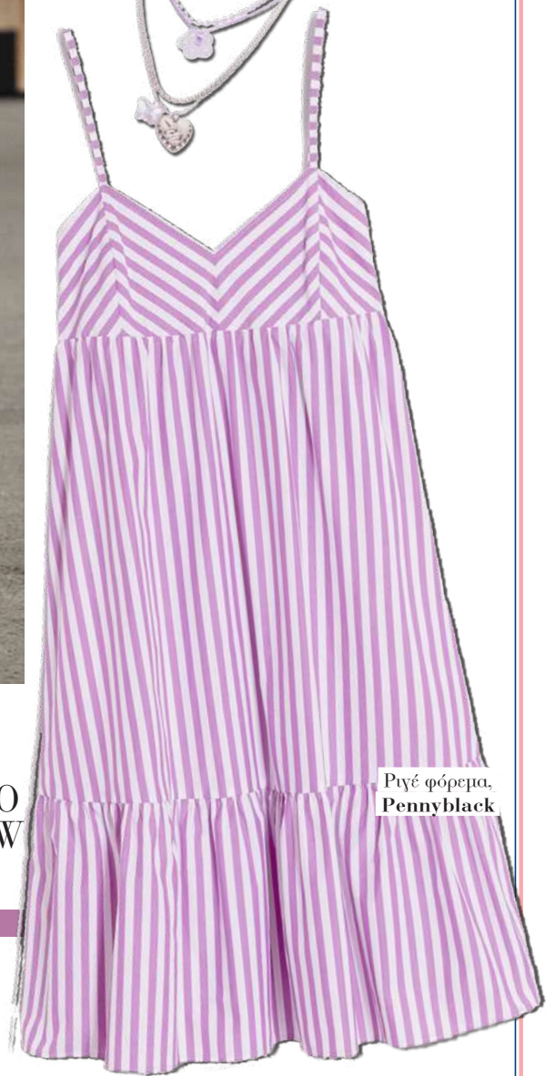
Ριγέ φόρεμα, Pennyblack