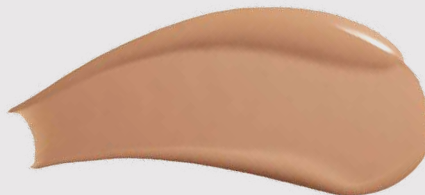
GIORGIO ARMANI, POWER FABRIC+

Το υγρό foundation Power Fabric καλύπτει τις ατέλειες με ένα ελαφρύ πέπλο και προστατεύει την επιδερμίδα από την ηλιακή ακτινοβολία με SPF 20. Η επιδερμίδα δείχνει πιο φωτεινή με ένα ελαφρύ ματ αποτέλεσμα.