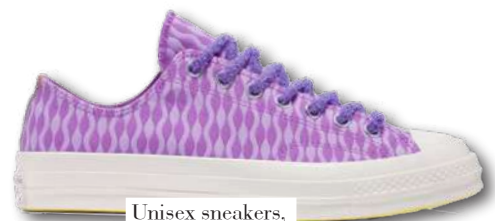
Unisex sneakers, Converse