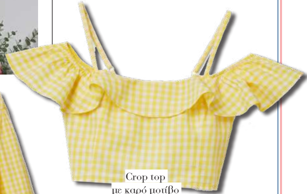
Crop top με καρό μοτίβο Benetton