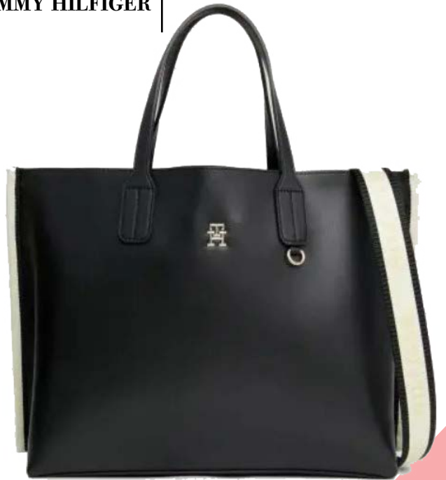
ICONIC ΤΣΑΝΤΑ ΧΕΙΡΟΣ ΜΕ ΛΟΓΟΤΥΠΟ TOMMY HILFIGER