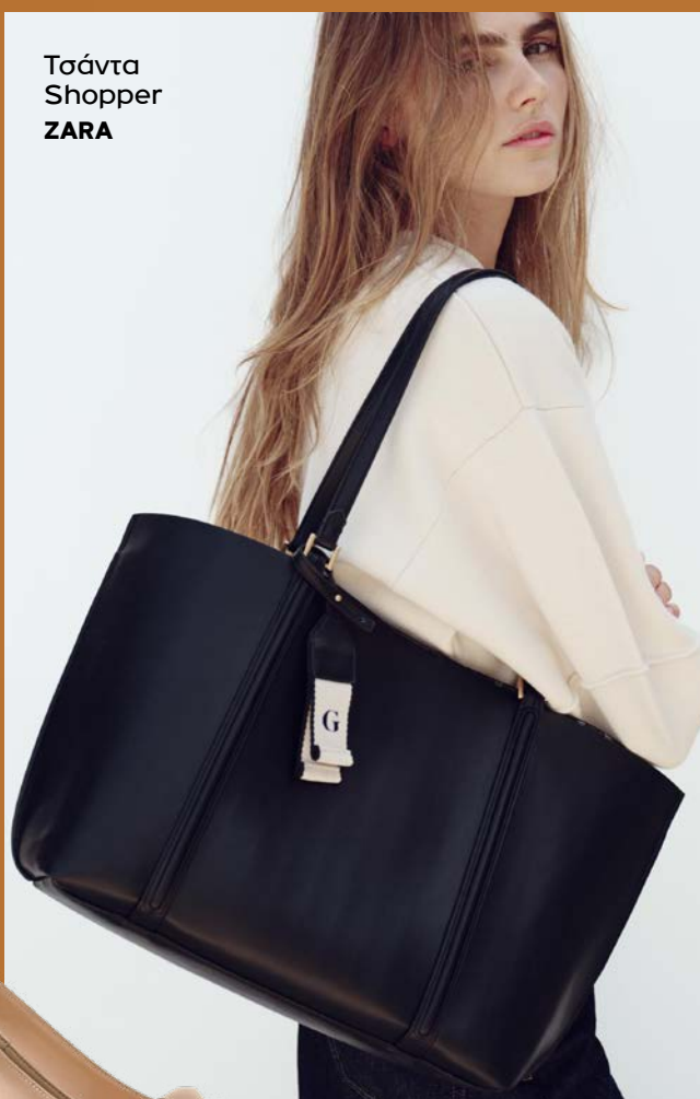
Τσάντα Shopper ZARA

A υτό το Φθινόπωρο, η μόδα έρχεται με έναν δυναμικό χαρακτήρα που ταιριάζει απόλυτα στη bossy γυναίκα που δε φοβάται να κλέψει την παράσταση! Η στιγμή να ανανεώσεις την γκαρνταρόμπα σου έφτασε, με τα νέα trends να προσθέτουν ακόμα παραπάνω στον αέρα της επιτυχίας και της αυτοπεποίθησης που χρειάζεσαι. Από κομψά σύνολα μέχρι εντυπωσιακά αξεσουάρ, αυτό το Φθινόπωρο ετοιμάσου να κάνεις αίσθηση με στυλ και άνεση που μπορεί να σταθεί τόσο στο γραφείο όσο και στις εξόδους με την παρέα σου. Σίγουρα τα must-have κομμάτια της φετινής σεζόν θα πάρουν μια μόνιμη θέση στη ντουλάπα σου!