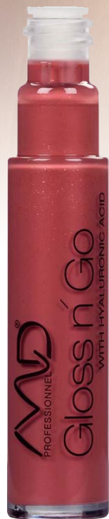
GLOSS N' GO