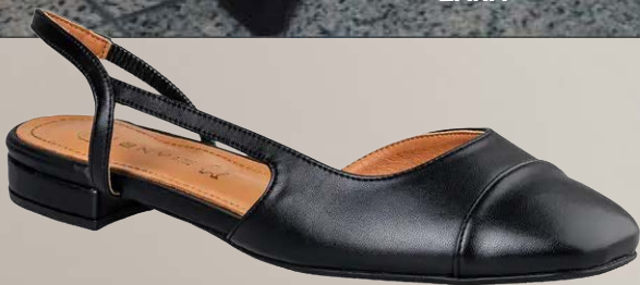
Slingback Ballet Flats ENVIE SHOES