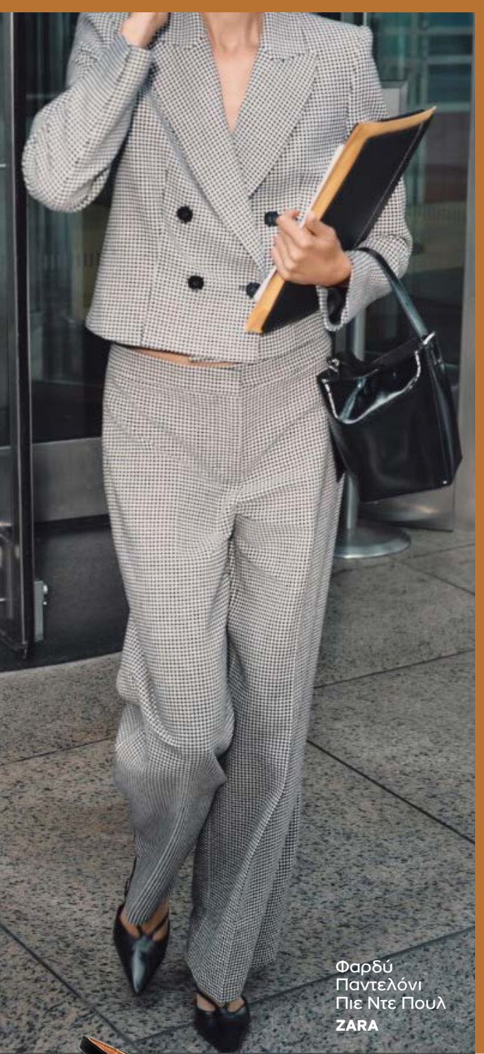
Φαρδύ Παντελόني Πιε Ντε Πουλ ZARA