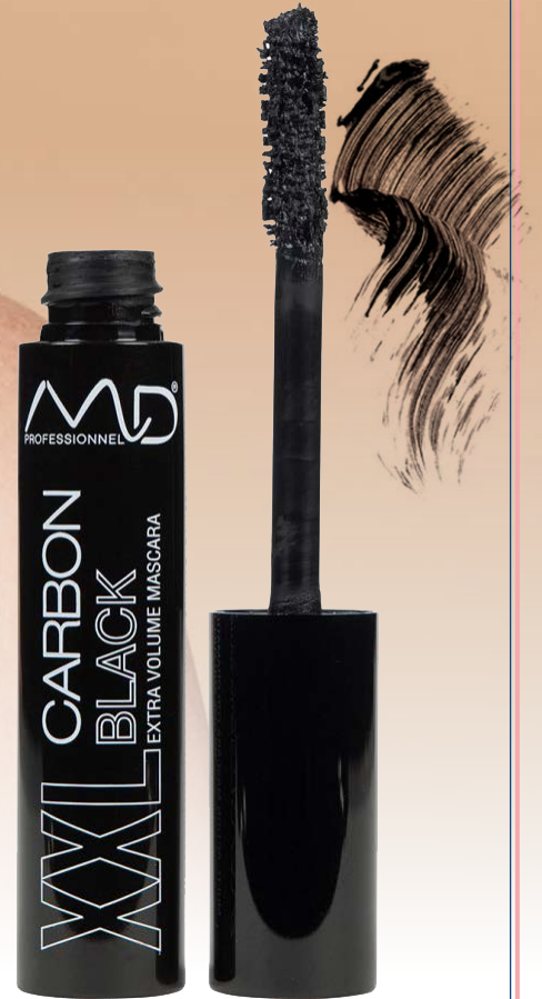
XXL CARBON BLACK MASCARA