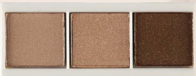
TRIPLE EYESHADOWS CLICK SYSTEM