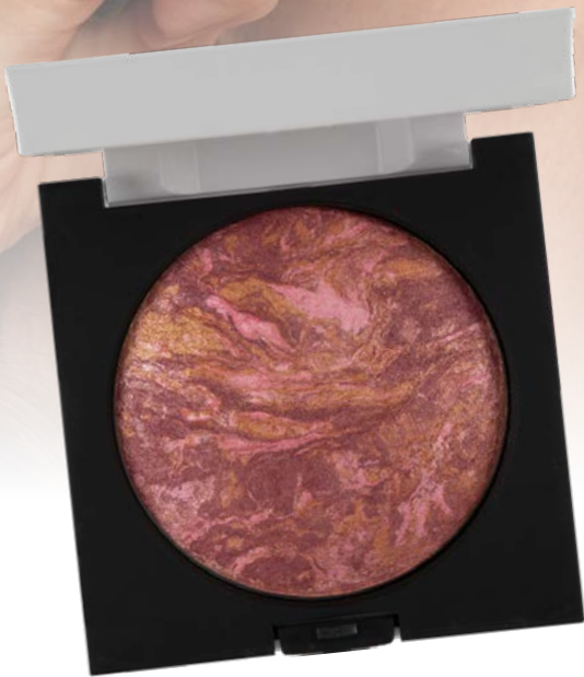
BRILLIANT BLUSH ON