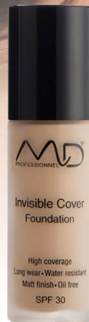
INVISIBLE COVER FOUNDATION