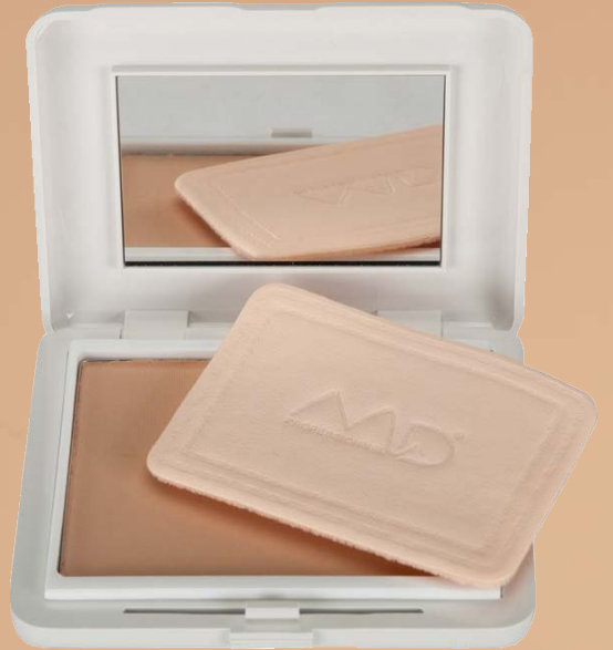
COMPACT POWDER CLICK SYSTEM