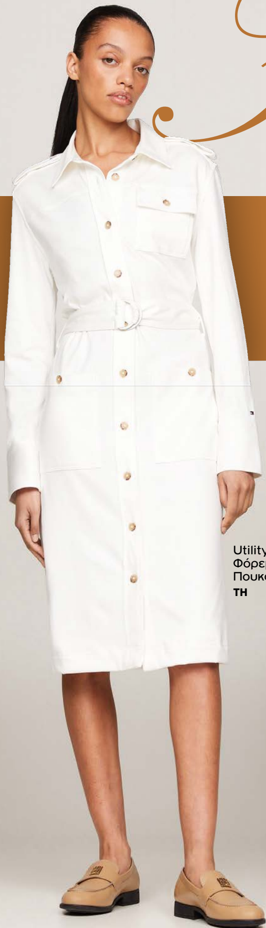
Utility Midi Φόρεμα Πουκαμίσια TH