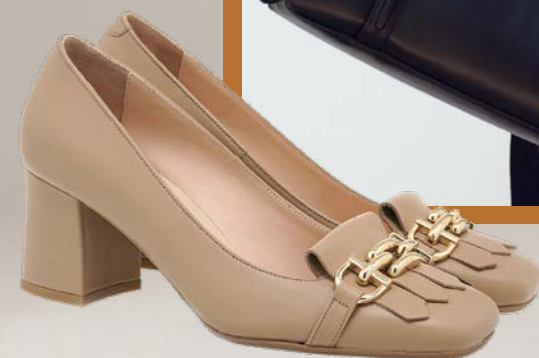
Leather Collection TSAKIRIS MALLAS

A υτό το Φθινόπωρο, η μόδα έρχεται με έναν δυναμικό χαρακτήρα που ταιριάζει απόλυτα στη bossy γυναίκα που δε φοβάται να κλέψει την παράσταση! Η στιγμή να ανανεώσεις την γκαρνταρόμπα σου έφτασε, με τα νέα trends να προσθέτουν ακόμα παραπάνω στον αέρα της επιτυχίας και της αυτοπεποίθησης που χρειάζεσαι. Από κομψά σύνολα μέχρι εντυπωσιακά αξεσουάρ, αυτό το Φθινόπωρο ετοιμάσου να κάνεις αίσθηση με στυλ και άνεση που μπορεί να σταθεί τόσο στο γραφείο όσο και στις εξόδους με την παρέα σου. Σίγουρα τα must-have κομμάτια της φετινής σεζόν θα πάρουν μια μόνιμη θέση στη ντουλάπα σου!